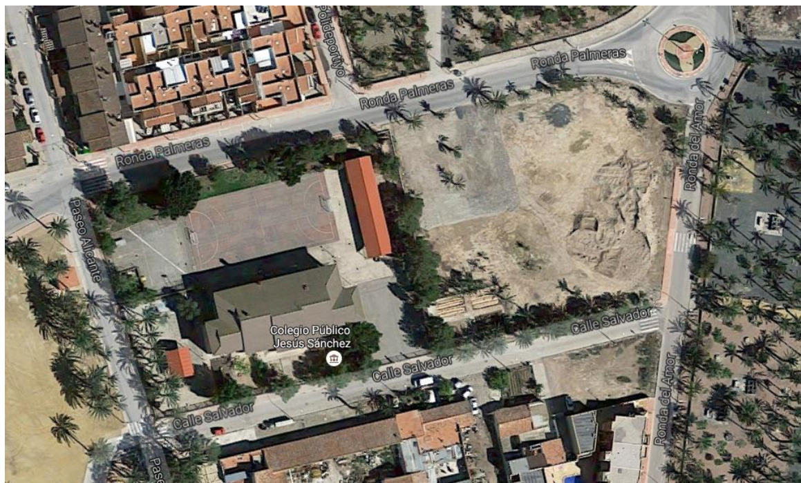
Imagen 2.a: Vista aérea de la manzana reservada a equipamiento docente en el planeamiento vigente

El planeamiento vigente dispone asimismo de una reserva adicional de suelo para equipamiento docente en la parcela colindante a la ocupada actualmente por el CEIP "Jesús Sánchez" con una superficie de 4.597 m 2 , la cual completa la manzana conformada por la ronda de las Palmeras , Ronda del Amor , Calle Salvador y Paseo Alicante .